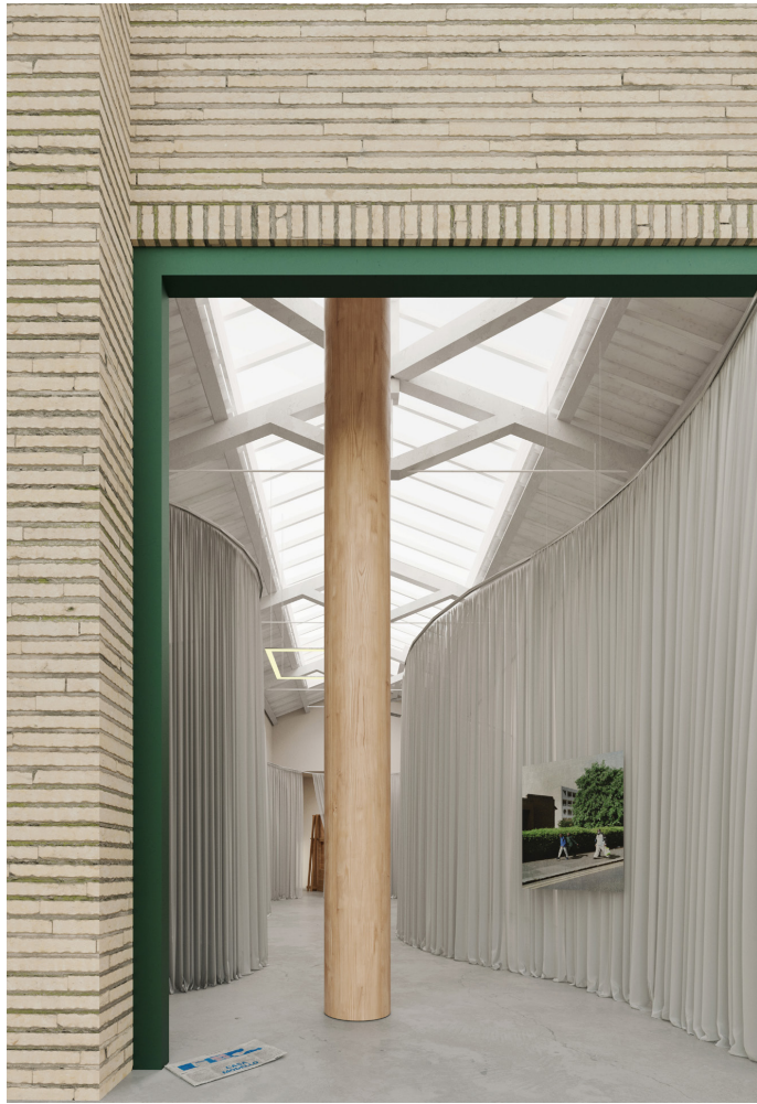
Casa Modello, Venecia, 2025