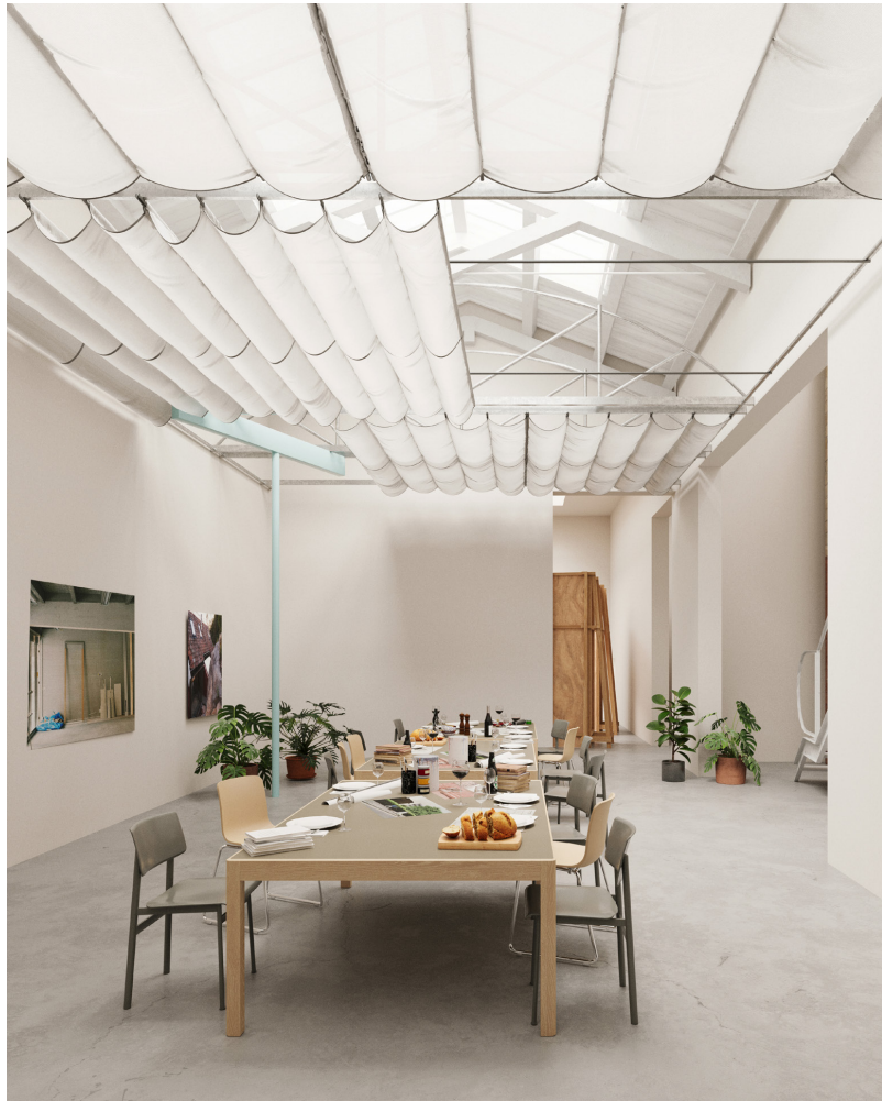
Casa Modello, Venecia, 2025