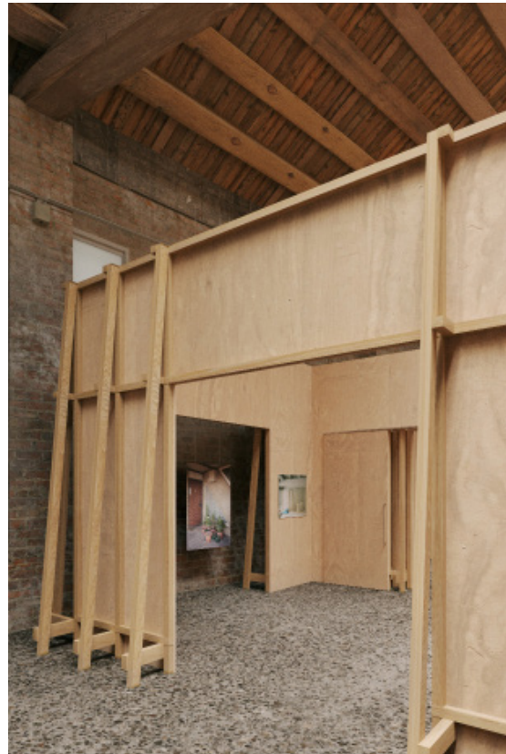
Casa Modello, Venecia, 2025